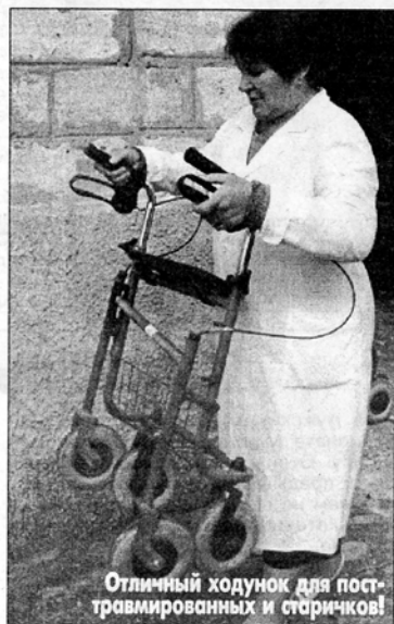
Отличный ходунок для посттравмированных и стариков!

Обстоятельные немцы тут же заехали в нее, вместе с главврачом прошлись по очень бедным ее помещениям, Малу начитала на диктофон названия всех аппаратов и мебели, в